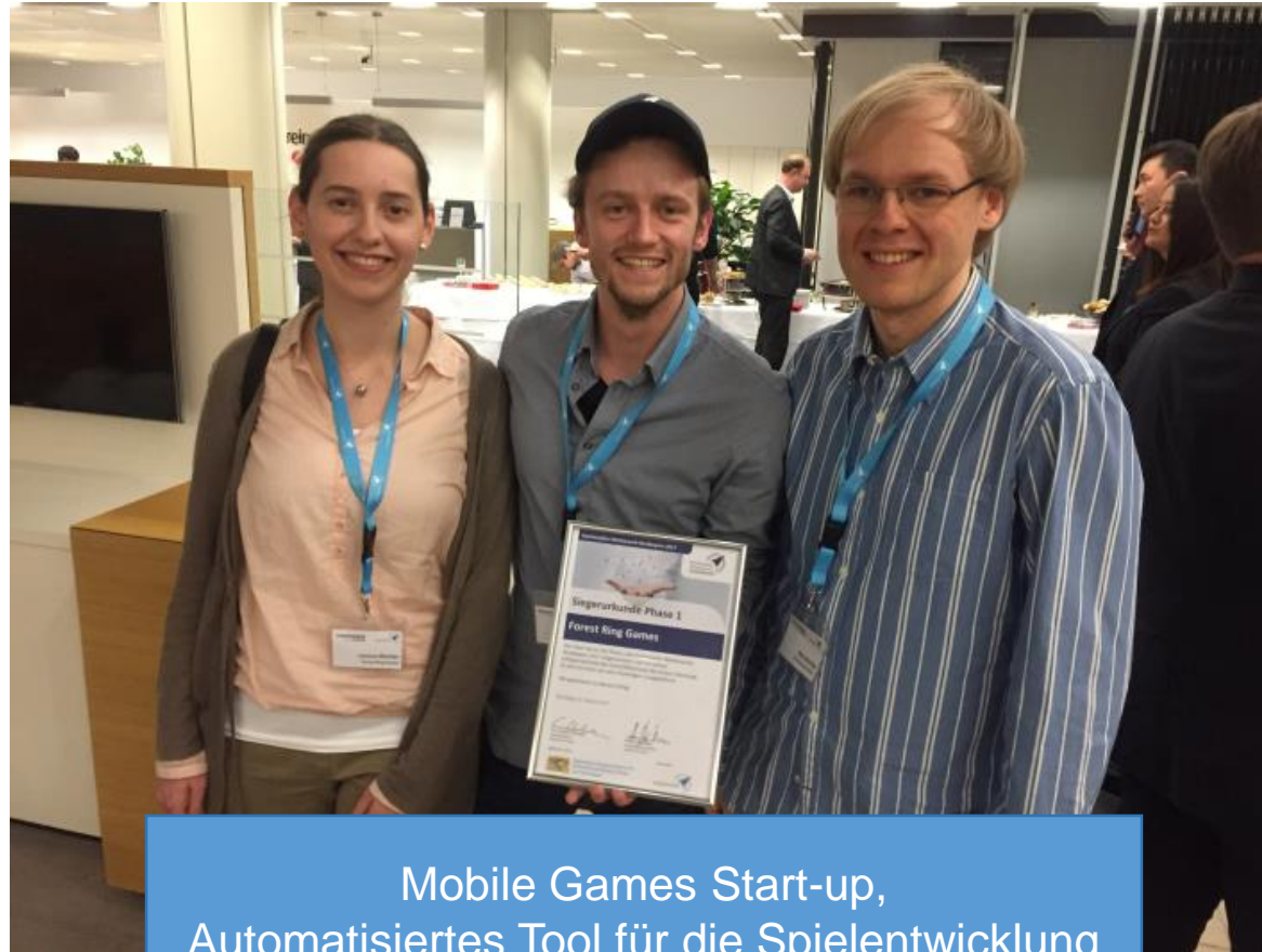
Mobile Games Start-up, Automatisiertes Tool für die Spielentwicklung