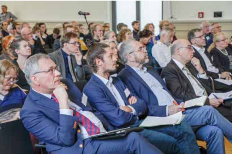
Blick in den Veranstaltungssaal in der Alten Mensa der Uni Göttingen

in einer nie dagewesenen Geschwindigkeit aussterben“. Deshalb sei es eine Minimalanforderung, dass die Politik auf der Grundlage wissenschaftlicher Erkenntnisse, konkret des Paris-Abkommens und IPCCs zu gestalten sei und im Rahmen demokratischer Aushandlungsprozesse die geeigneten Instrumente zur Erreichung der festgelegten Ziele diskutiert werden könnten.