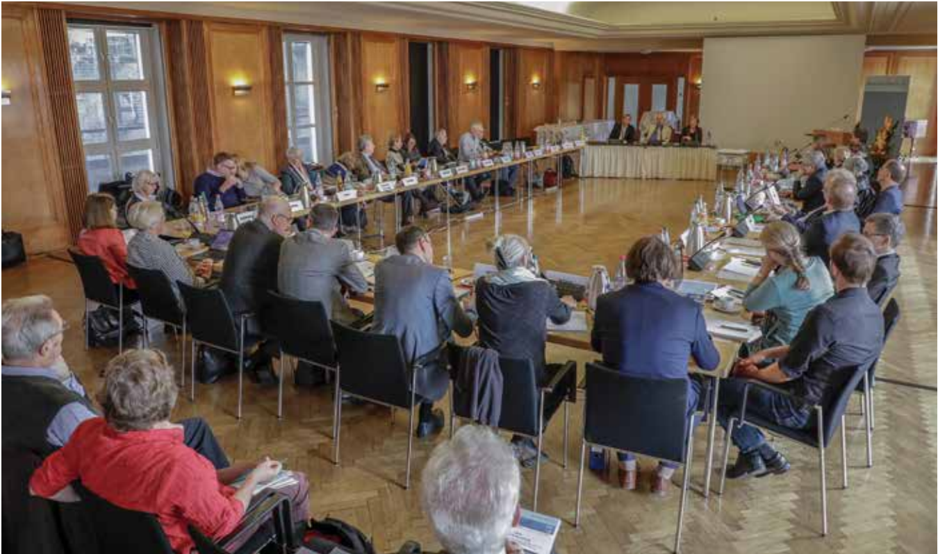
Blick in den Einstein-Saal der Berlin-Brandenburgischen Akademie der Wissenschaften während der öffentlichen Sitzung des Ethikrates zum Thema Interessenkonflikte in der Ethikberatung

tionsbeschaffung für politische Entscheidungen bestehe, hänge entscheidend davon ab, dass „die Unabhängigkeit und Glaubwürdigkeit der beteiligten Wissenschaftler [...], die Offenheit der interdisziplinären wissenschaftlichen Auseinandersetzung und die Reputation der Rat gebenden Institution nicht infrage gestellt werden“. Maßnahmen wie Befangenheitsregeln, aber auch Inkompatibilitätsregelungen, Karenzzeitregelungen und Offenlegungspflichten hätten deshalb immer eine doppelte Zielsetzung und seien sowohl auf die Vermeidung individueller Interessenkonflikte wie auch die Vermeidung von Reputationsschäden für das Gesamtgremium gerichtet. Um dies zu gewährleisten, empfahl Müller dem Ethikrat, seine Geschäftsordnung in Orientierung an den Verhaltensleitlinien des Bundesverfassungsgerichts dahingehend zu ändern, dass auch Zuwendungen jeglicher Art „nur in sozialen Zusammenhängen und in einem Umfang entgegen[genommen werden dürfen], die keine Zweifel an der persönlichen Integrität und Unabhängigkeit entstehen lassen können“ und für die Mitwirkung an Veranstaltungen nur insoweit, „als dies das Ansehen des Rates nicht beeinträchtigen kann“. Zudem sollten alle Mitglieder angehalten sein, darauf zu achten, dass sie in ihrem gesamten