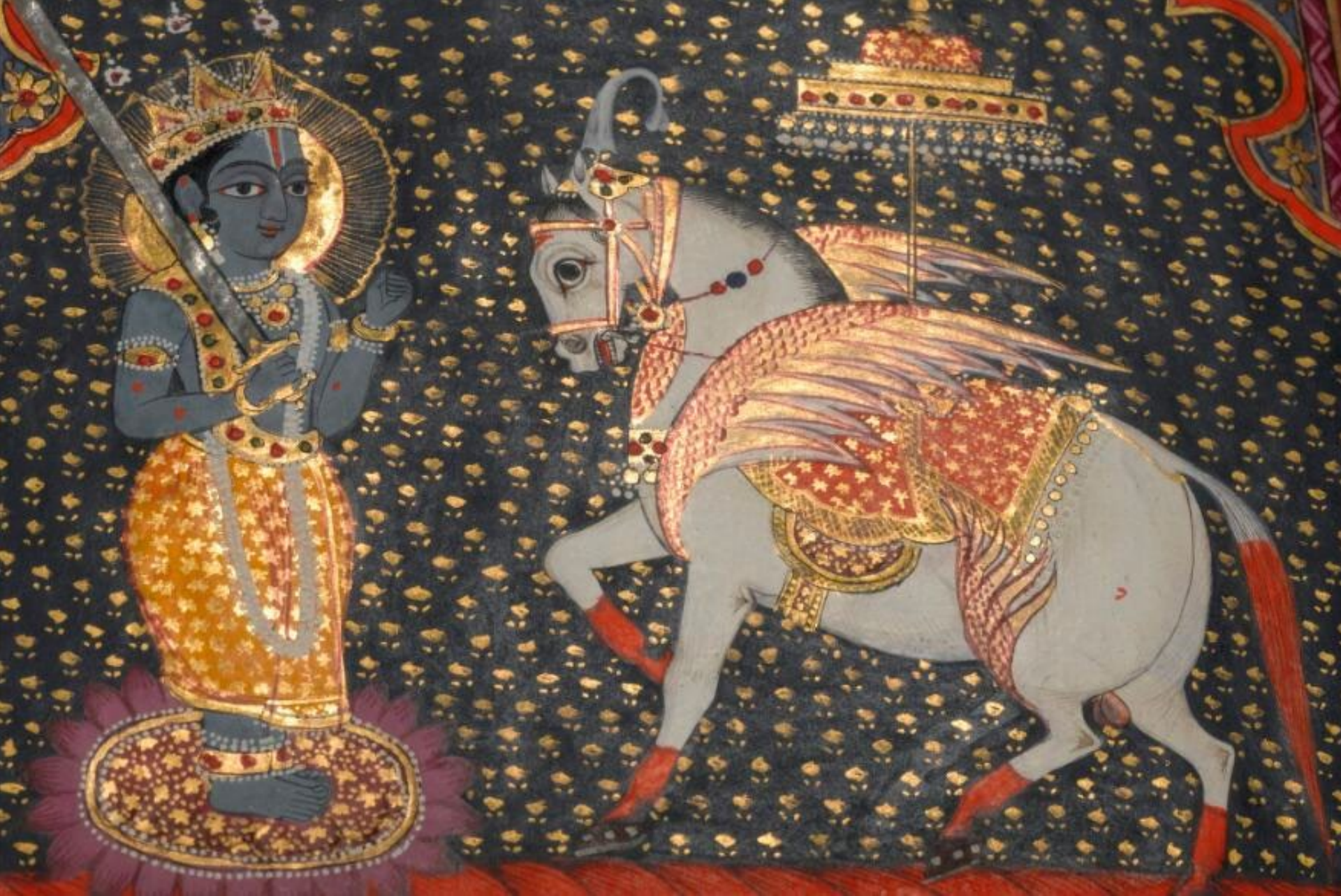
„Kalki Avatar Visnu. Panjabi manuscript 255“, Wellcome Collection, London