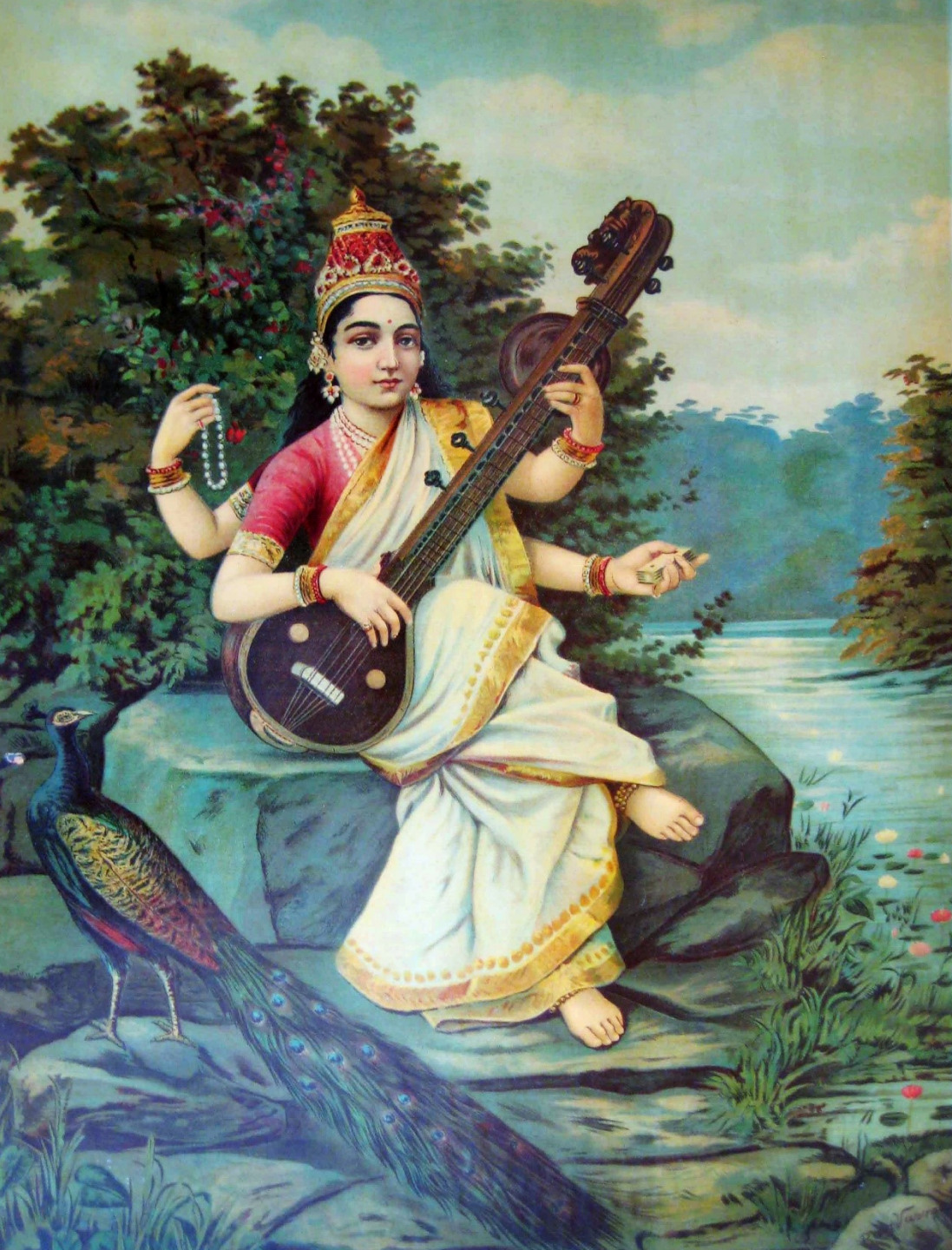
Lithographie von Ravi Varma (1894)