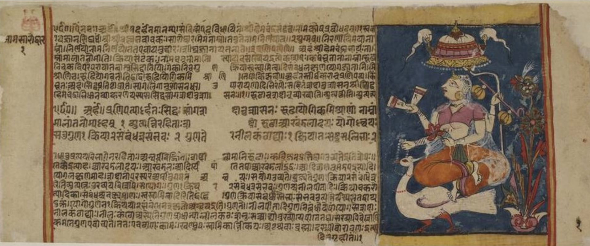
Abhidhānacintāmaṇi with Nāmasāroddhāra commentary (Or. 13806), ca. 15. Jh.